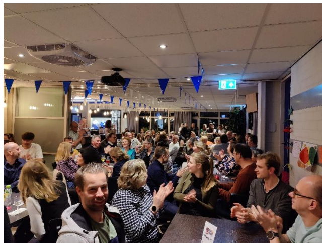
Volle kantine tijdens de Pubquiz

Tenslotte zorgen de wedstrijden die door de Wedstrijd Organisatie Commissie worden georganiseerd voor goede aanloop naar ons clubhuis. Net als vorig jaar zijn de Ben Saris Meerkampen (met de 3 dagen die dit evenement duurt, het hoge deelnemersaantal, de vele bezoekers en het aanbieden van ontbijt en barbecue) het aller drukst.