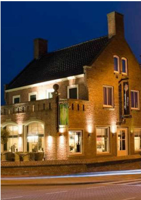
Ristorante Ortica "Waar Nederland Italië proeft!"