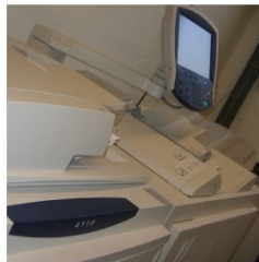
print & kopieerwerk folders, flyers, visits, boekjes rapporten, bouwtekeningen