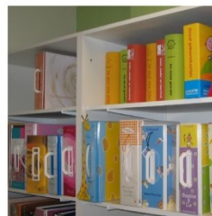
geboortekaartjes trouwkaarten gelegenheidskaarten

Buitenweg 9a • 5683 PM Best • tel. (0499) 37 29 30 best@druk-en-kopie.nl • www.druk-en-kopie.nl