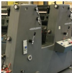
offsetdruk briefpapier, visitekaartjes enveloppen, folders, posters